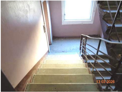
Skats kāpņu telpā