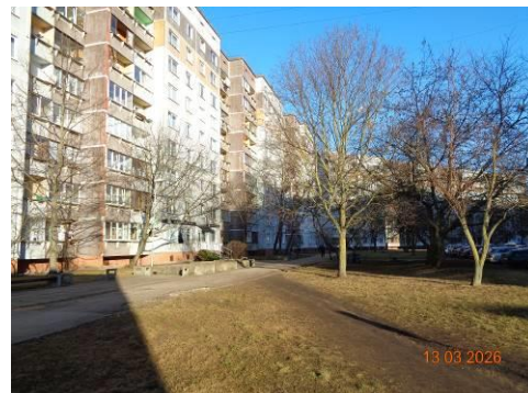
Apzaļumota zona un pastaigu celiņš pie Ēkas