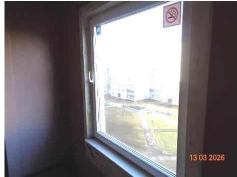
PVC logs kāpņu telpā