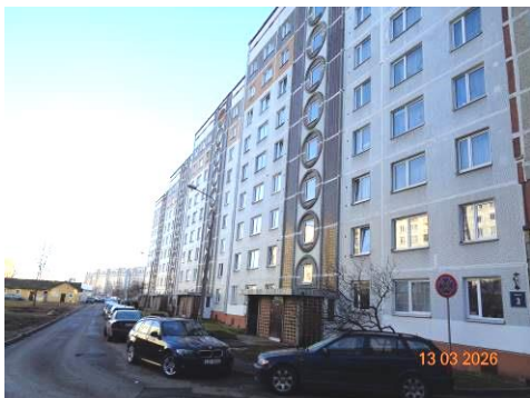
Piebraucamā ceļa posms pie Ēkas