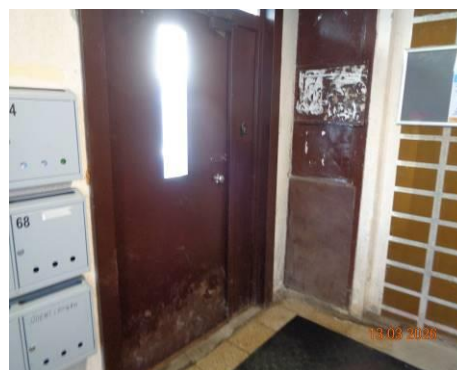
Ieeja Ēkas kāpņu telpā, kurā atrodas Dzīvoklis