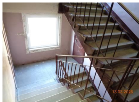
Skati kāpņu telpā